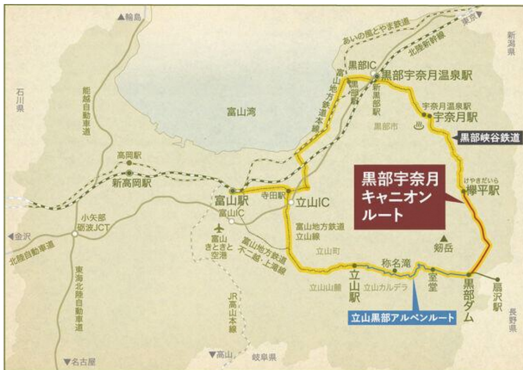
黒部宇奈月キャニオンルート-MAP2