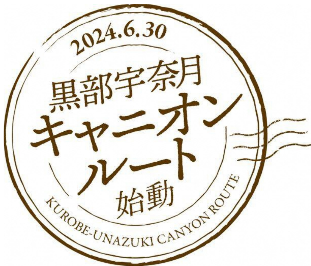
黒部宇奈月キャニオンルート始動

一般開放日まで8か月。引き続き、観光客の皆様をお迎えする準備を進めてまいります。