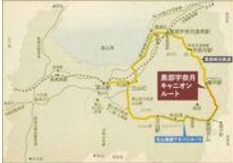
黒部宇奈月キャニオンルート-MAP2