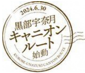
黒部宇奈月キャニオンルート始動